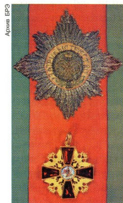
Орден Святого Благоверного великого князя Александра Невского (Российская империя): звезда, лента и крест ордена.

бурге. Всего А. Н. о. награждено ок. 3 тыс. чел., среди них – Я. В. Брюс, А. Д. Меншиков, А. И. Репнин (все в 1725), К. Г. Разумовский (1746), И. И. Шувалов (1751), П. А. Румянцева-Задунайский (1759), А. П. Ганнибал, И. И. Бецкой (оба в 1760), А. В. Суворов (1771), А. А. Безбородко (1784), М. И. Кутузов (1791), Ф. Ф. Ушаков (1792), М. Б. Барклай де Толли, А. П. Ермолов (оба в 1813). Орден упразднён декретом ВЦИК и СНК от 10(23).11.1917. 2) Александра Невского орден, одна из высших воен. наград в СССР. Учреждён 29.7.1942 в ходе Вел. Отеч. войны 1941–45. Согласно статуту, орденом награждались командиры дивизий, бригад, полков, батальонов, рот и взводов «за выдающиеся заслуги в организации и руководстве боевыми операциями и за достигнутые в результате этих операций успехи в боях за Родину», а также командиры, «проявившие в боях за Родину в Вел. Отеч. войне личную отвагу, мужество и храбрость и умелым командованием обеспечившие успешные действия своих частей». Имел одну степень. Знак А. Н. о. – серебряная, покрытая рубиново-красной эмалью выпуклая