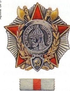
Орден Александра Невского (СССР, Российская Федерация): знак и лента ордена.